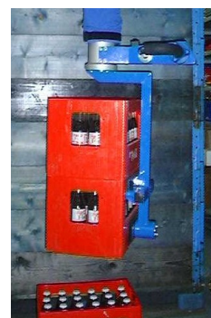
Lyftdon till linlyftare & slanglyftare.

Din partner vid val av funktionslösningar inom lyft och hantering av lättare gods.