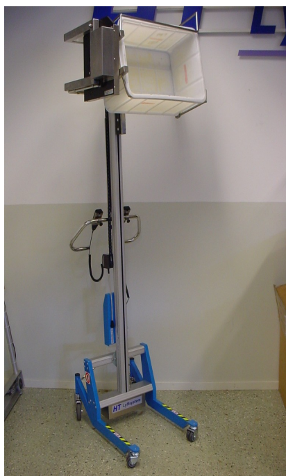
Tömning av back framåt.