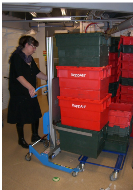
Hämta backen direkt från backvagnen