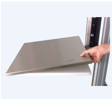
Flakskydd i rostfritt till flaket med polyeten plastsiva