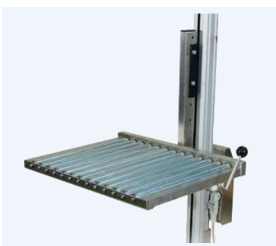
Sidomatat rullflak med låsning