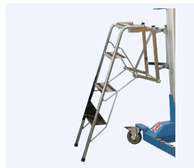
Steg som är hopfällbar