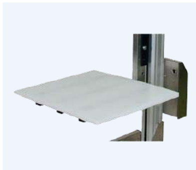
Flak i polyeten plast

Det finns ett stort antal standardverktyg, för allt slags gods, lastplan, V-block, lyftbom samt en manuell expander, för hantering av rullar men en av våra stora fördelar är att vi även skapar kundanpassade tillbehör.