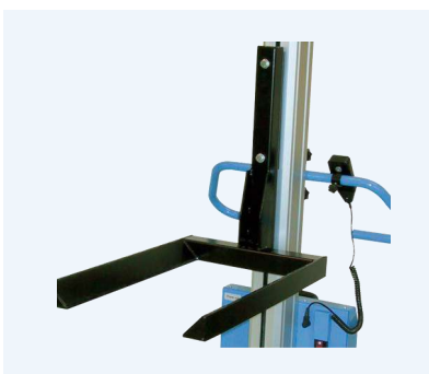
Lyftgaffel som kan anpassas efter behov