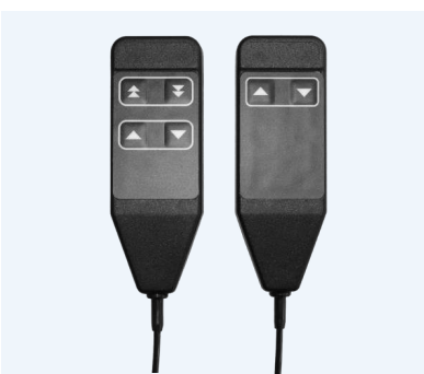
Manöverdosor med två eller fyra knappar för olika hastigheter