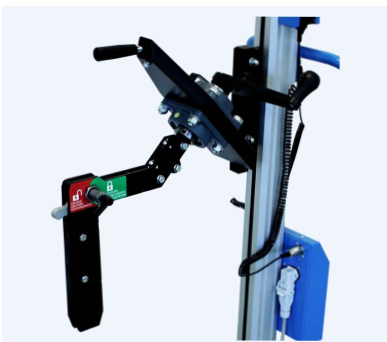
Manuell expander för att lyfta och vrida smårullar i kärnan