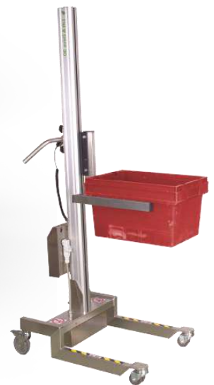
Lyftgaffel som kan kundanpassas

90IE är en smidig och pålitlig lyftvagn som kombinerar enkelhet med effektivitet. Dess kompakta design gör den lätt att använda och förvara, vilket gör den idealisk för miljöer som storkök, kontor, bibliotek, butiker och industriella verksamheter.