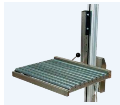
Rullflak med låsfunktion med frontmatning