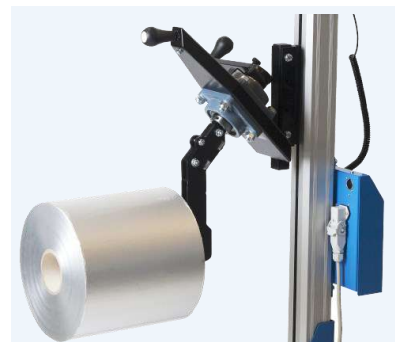
Den manuella expandern med rulle