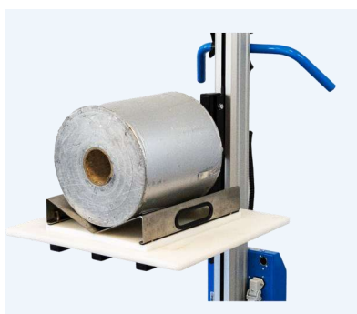
Flak med V-block, kombinerat med snurrskivan roterar V-blocket så att rullen kan positioneras rätt