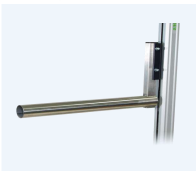
Lyftbom för hantering av liggande rullar