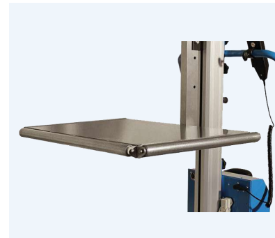
Flak med kantrullar, kantrullarna kan fås på önskade sidor