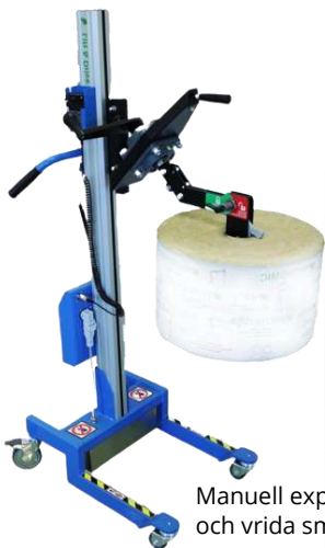
Manuell expander för att lyfta och vrída smårullar i kärnan

Riskera aldrig skador på personal eller varor på grund av överbelastning. Överbelastningsskyddet är till för att vagnen inte ska lyfta mer än den är konstruerad för.