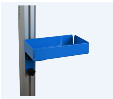
Förvaringshylla som monteras på pelaren