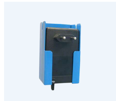
Batteriladdare och håller till laddaren