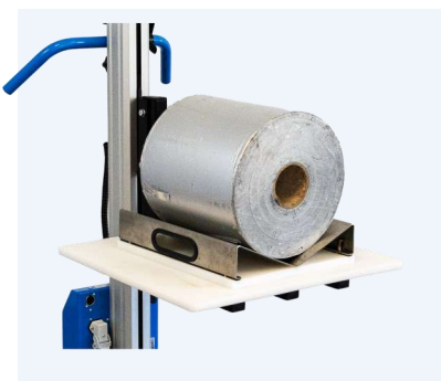
Flak med V-block, kombinerat med snurrskivan roterar V-blocket så att rullen kan positioneras rätt