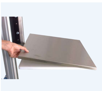
Flakskydd i rostfritt till flaket i plast