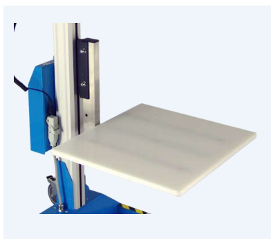
Flak i standardstorlek 498x440mm

Det finns ett stort antal standardverktyg, lastplan, V-block, lyftbom samt en manuell expander, för att hantera rullar. En av våra stora fördelar är dock att vi även skapar kundanpassade tillbehör.