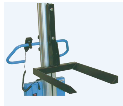
Lyftgaffel som vi kan kundanpassa