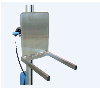
Lyftgaffel som kan anpassas efter behov, här med fällbar flakskiva